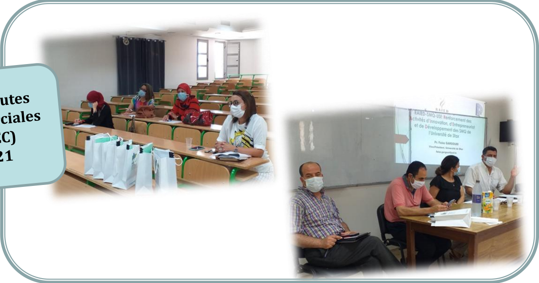
Institut des Hautes Etudes Commerciales de Sfax (IHEC) 24 Juin 2021