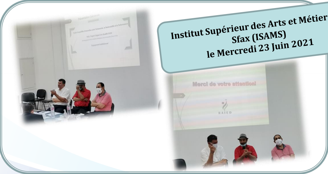
Institut Supérieur des Arts et Métiers de Sfax (ISAMS) le Mercredi 23 Juin 2021