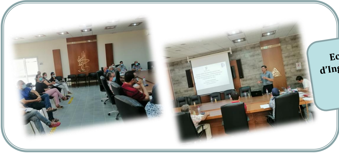
Ecole Nationale d'Ingénieurs de Sfax (ENIS) 28 Juin 2021