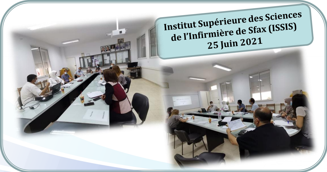
Institut Supérieure des Sciences de l'Infirmière de Sfax (ISSIS) 25 Juin 2021