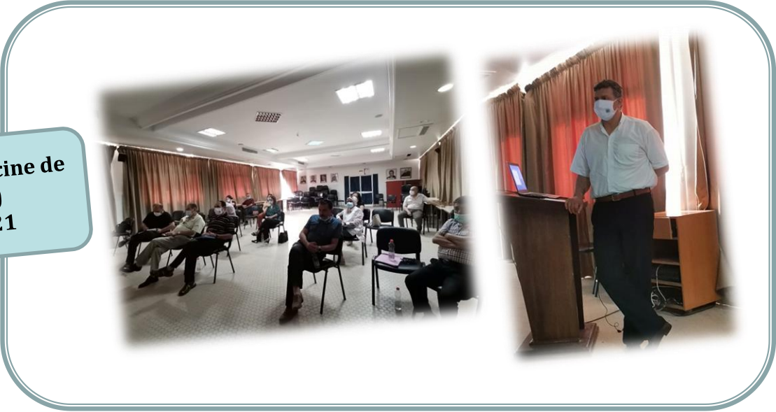
Faculté de Médecine de Sfax (FMS) 25 Juin 2021