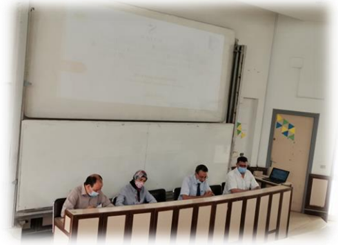
Institut Préparatoire aux Etudes d'Ingénieurs de Sfax (IPEIS)