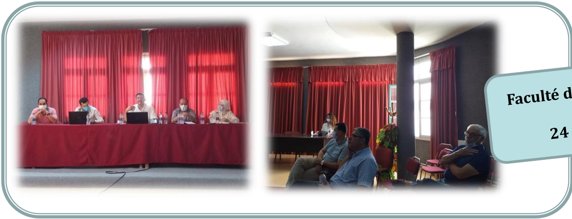
Faculté de Droit de Sfax (FDS) 24 Juin 2021